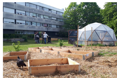
©Environnements Solidaires La Petite Ferme Urbaine - Saint-Herblain