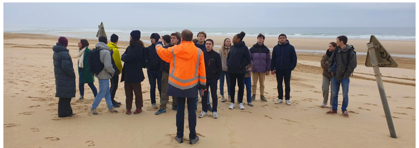
En haut à gauche : atelier de spécialisation avec les M1 sur l'île de Bailleron (déc. 2023) - En haut à droite et en bas : semaine de rencontre d'acteurs avec les M2 ou SIBA (Syndicat Intercommunal du Bassin d'Arcachon) en janvier 2024 (visite de l'EAU'ditorium à Biganos, sortie terrain sur la plage de Biscarosse)