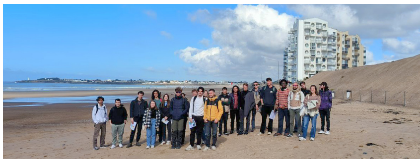
En haut à gauche : jeu sérieux Littopia sur l'adaptation aux risques côtiers avec les M2 GER - En haut à droite : les étudiant-es du M2 GER 2024-2025 aux GéoDataDays - En bas : approche terrain des espaces à risques des M1 à Saint-Gilles-Croix-de-Vie (Vendée)